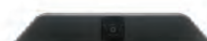
Webcam Full HD Camera