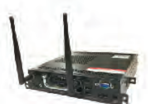
PC Module (OPS)